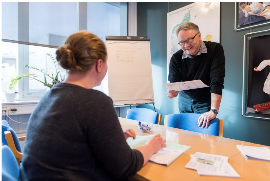
Vejledning i Padborg