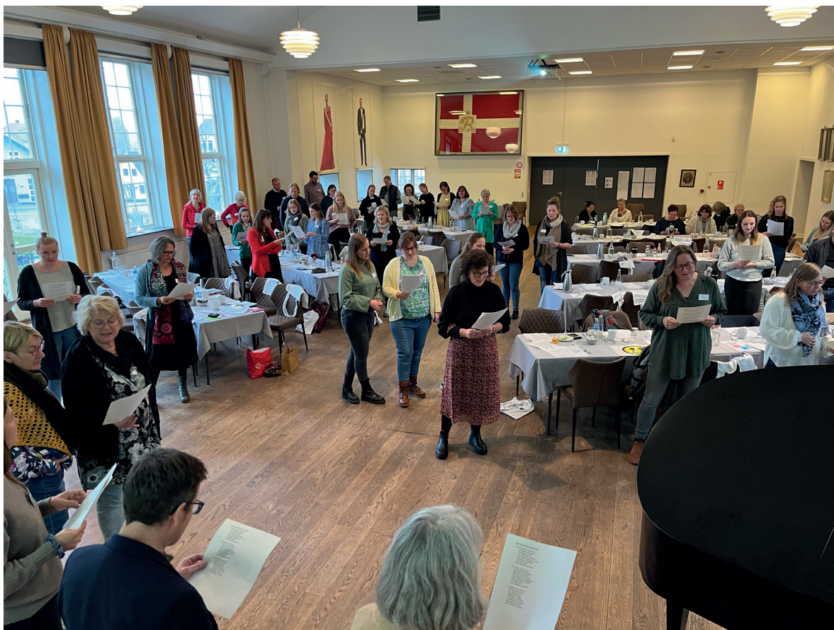
Deutsch-dänische Lehrerkonferenz 10.11.2022, Region Sønderjylland-Schleswig

Der deltog omkring 100 lærere i konferencen.