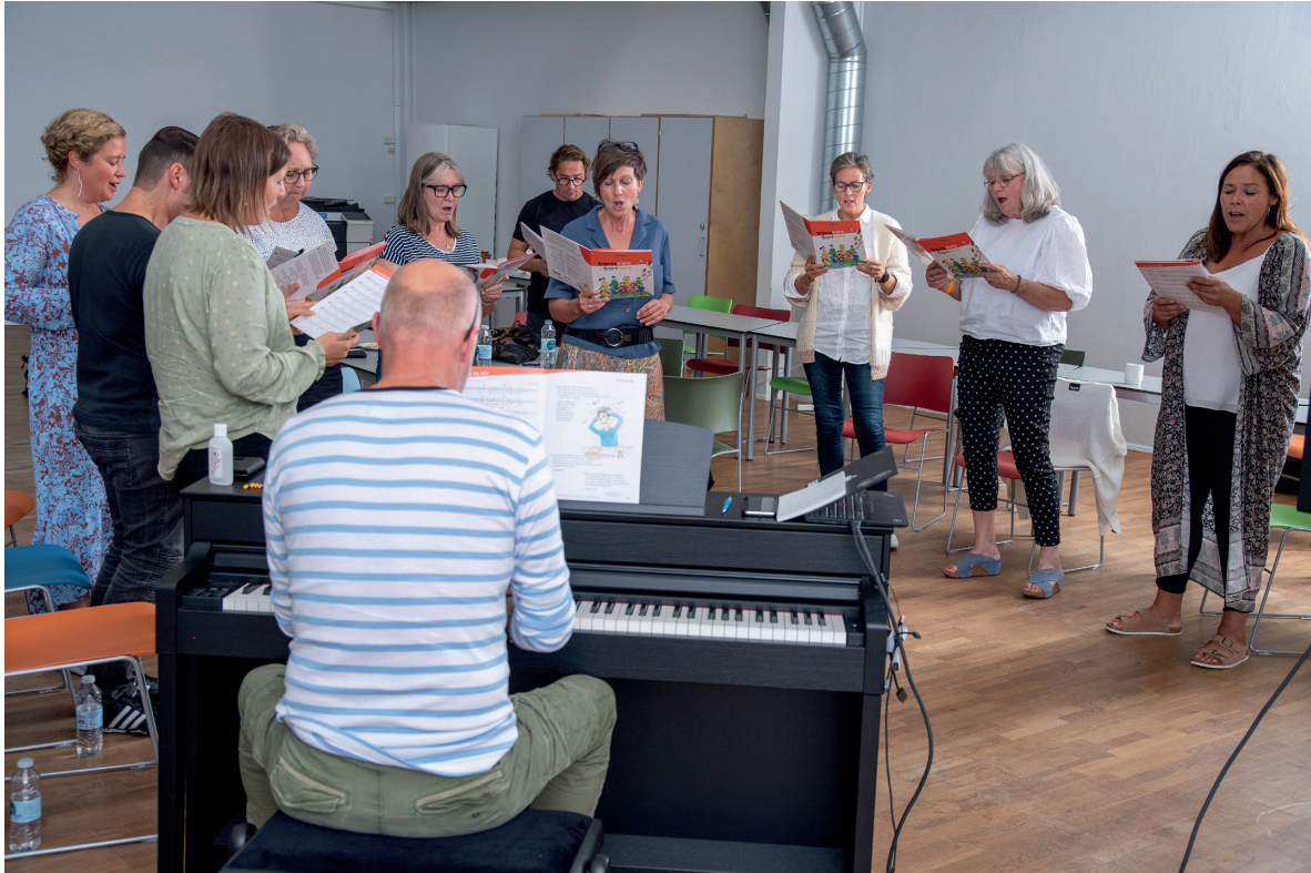
Grenzklang, nordpool / Tim Riediger

I alt er der gennemført 32 projekter med støtte fra kultur- og netværkspuljen. Den samlede støttesum var på 5.013.447 DKK / 672.945 EUR. Det samlede antal støttede projekter gennem kultur- og netværkspuljen er lavere end forventet. Det skyldes, at den gennemsnitlige støttesum er højere end antaget samt projektaflysninger pga. pandemien.