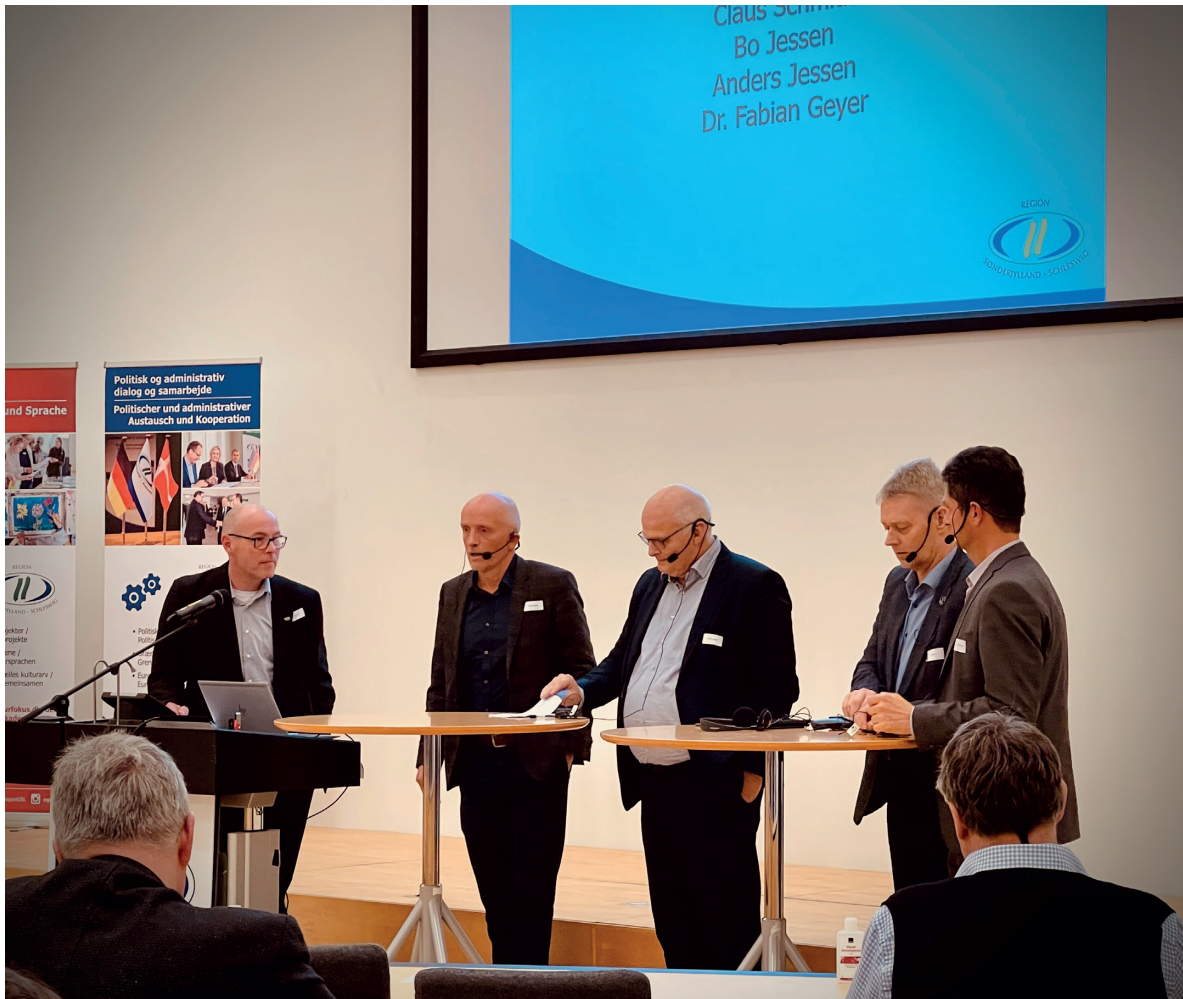
Paneldebat Regionaldag 10.11.2022, Region Sønderjylland-Schleswig

På Regionaldagen, som blev afholdt den 10. november 2022, var der fokus på manglen på arbejdskraft i regionen. De forskellige konsekvenser blev belyst og diskuteret i foredrag og paneldiskussioner.