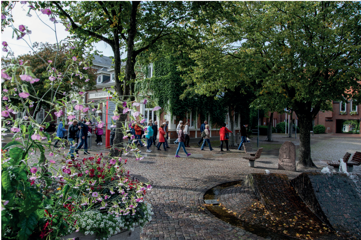
Kultur i hverdagen – litterære byvandring

Udover midler fra kulturaftalen modtog eventen også støtte fra Fabrikant Mads Clausen Fond. Klimatopmødet var startskuddet for den dansk-tyske ungepulje, som var åben for ansøgninger i 2022. Der blev bevilget to ansøgninger: "Dansk-tysk sejltur for unge" og "Frøsåningsaktion for unge". Begge projekter er planlagt til gennemførelse i første halvdel af 2023.