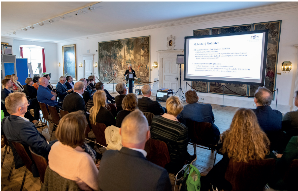
Slotsdialog de 15.09.2022 på Schloss Glücksburg

Region Sønderjylland-Schleswig afholdte for første gang arrangementet sammen med Industrie- und Handelskammer zu Flensburg og Handwerkskammer Flensburg. Baseret på en model fra den tysk-tjekkiske grænseregion, bliver inviterede eksperter bedt om at deltage i specialistfora for at belyse de udfordringer man har identificeret. Resultaterne danner grundlag for det videre arbejde. I 2022 blev der sat fokus på grænseoverskridende digitalisering, stiftelse hos naboen og indberetningspligt ved udstationering. På grund af den store succes bliver arrangementet gentaget årligt i fremtiden.