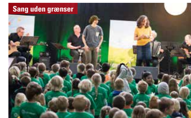
Sang uden grænser