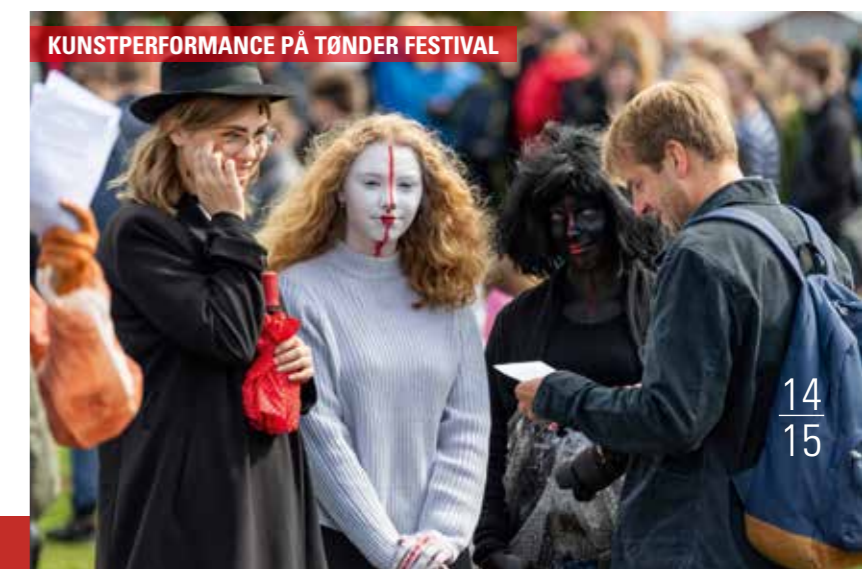
KUNSTPERFORMANCE PÅ TØNDER FESTIVAL