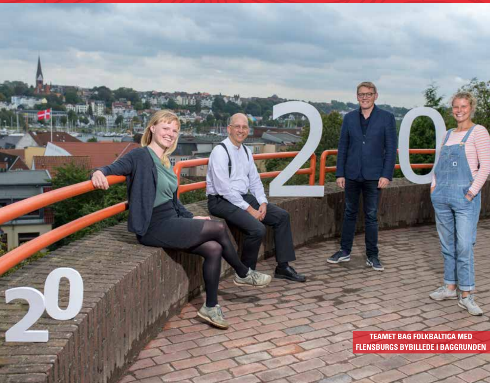
TEAMET BAG FOLKBALTICA MED FLENSBURGS BYBILLEDE I BAGGRUNDE