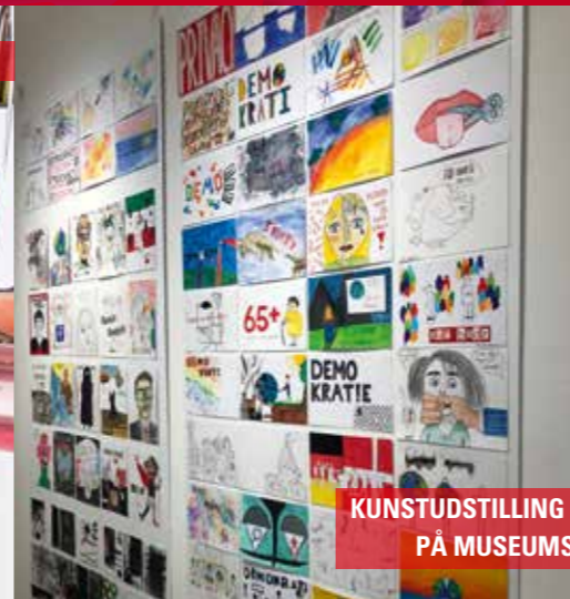
KUNSTUDSTILLING "PERSPEKTIVWECHSEL" PÅ MUSEUMSBERG FLENSBURG